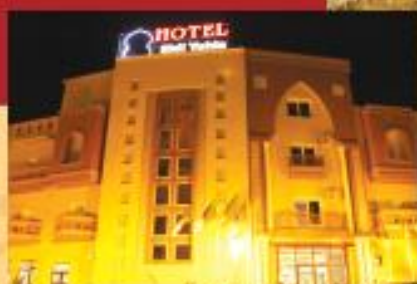
Complexe Thermal SIDI YAHIA