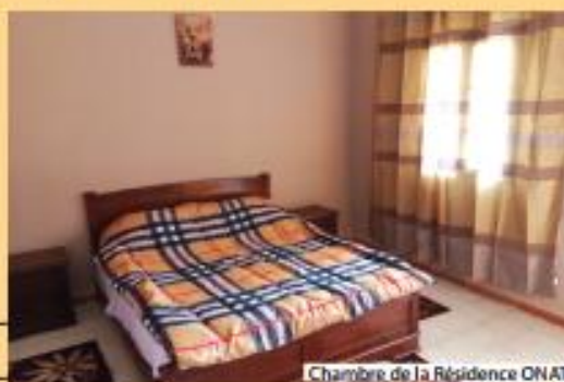
Chambre de la Résidence ONAT

Après le petit déjeuner, départ vers Béchar, visite de la ville et du Ksar de Kenadsa. Retour vers Oran avec un déjeuner en cours de route.